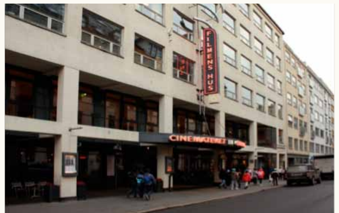
The Norwegian Film Institute L'Institut national du Film Instituto cinematográfico noruega