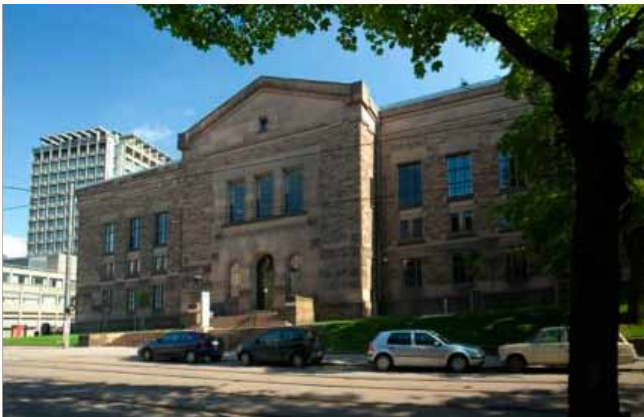
The National Library of Norway La Bibliothèque nationale de Norvège Biblioteca nacional noruega