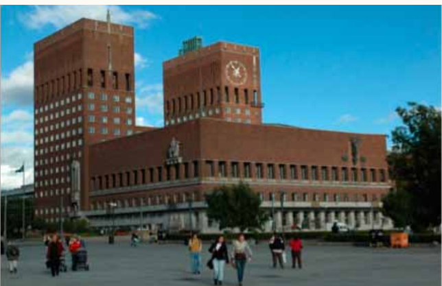
Oslo City Hall L'Hôtel de Ville d'Oslo Ayuntamiento de Oslo