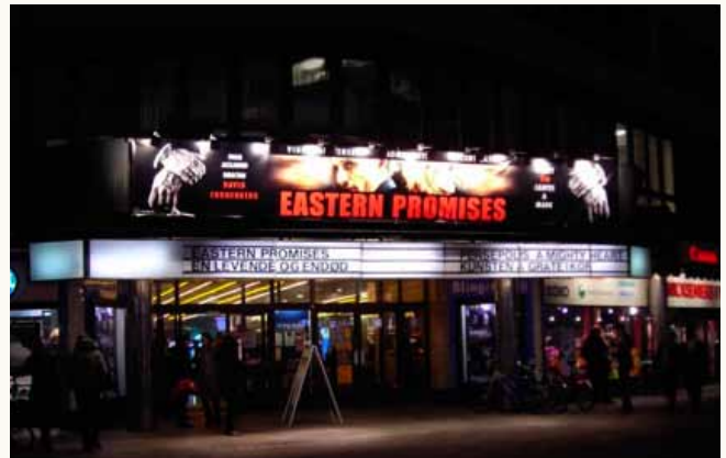
Klingenberg Cinema Le cinéma Klingenberg Cine Klingenberg